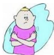
Trema a causa del nervoso